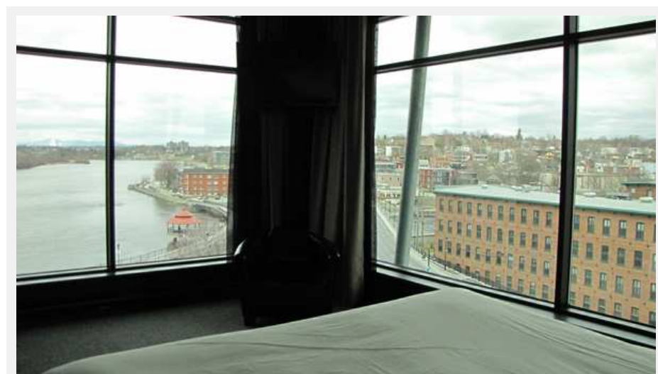
Cette suite offre une vue vertigineuse sur Sherby, le lac et les montagnes au loin.